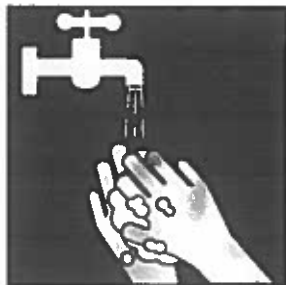
Afspoelen met water