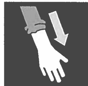
Mouw weer omlaag

Handen worden gewassen door pedagogisch medewerkers en kinderen