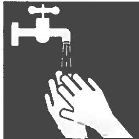
Handen nat maken