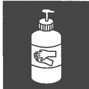
Met zeep handen wassen